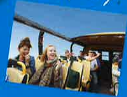
運行会社/明星観光バス ※写真はイメージです。